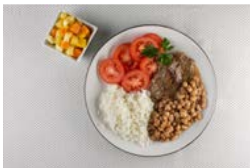
Salada de tomate, arroz, feijão, bife grelhado e salada de frutas

Aqui apresentamos a composição do almoço de oito brasileiros selecionados entre aqueles que baseiam sua alimentação em alimentos in natura ou minimamente processados.