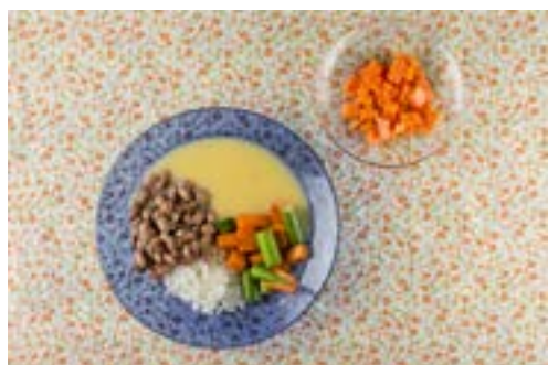
Arroz, feijão, angu, abóbora, quiábo e mamão