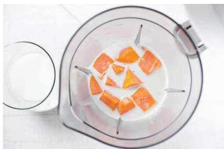
Leite batido com frutas