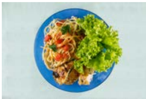
Salada de folhas, macarrão e galeto

Aqui apresentamos a composição do jantar de oito brasileiros selecionados entre aqueles que baseiam sua alimentação em alimentos in natura ou minimamente processados.