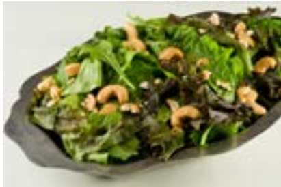
Salada de folhas com castanhas de caju