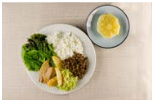
Alface, arroz, lentilha, pernil, batata, repolho e abacaxi