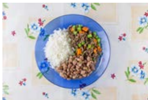
Arroz, feijão, carne moída com legumes

Carnes de boi ou de porco novamente estão restritas a um terço das refeições apresentadas. Nas demais refeições, frango, peixe, ovos e vários tipos de preparações de legumes e verduras ilustram opções para substituir carnes vermelhas.