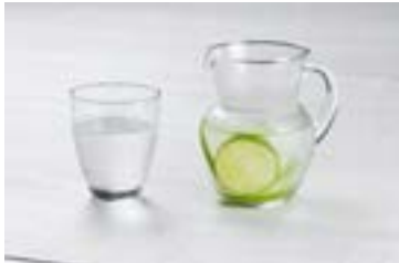
Água com limão

A água é essencial para a manutenção da vida. Sem ela, não sobrevivemos mais do que poucos dias. O total de água existente no corpo dos seres humanos corresponde a 75% do peso na infância e a mais da metade na idade adulta.