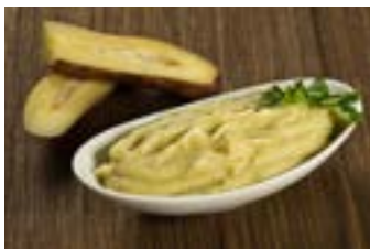
Purê de batata-doce

Este grupo inclui a mandioca, também conhecida como macaxeira ou aipim, batata ou batata-inglesa, batata-doce, batata-baroa ou mandioquinha, cará e inhame.