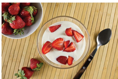
Iogurte com frutas

Frutas frescas ou secas são excelentes alternativas, bem como leite, iogurte natural e castanhas ou nozes, na medida em que são alimentos com alto teor de nutrientes e grande poder de saciedade, além de serem práticos para transportar e consumir.