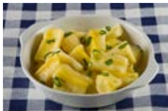
Mandioca cozida com cebolinha e/ou salsinha