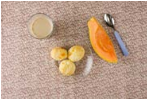
Café com leite, pão de queijo e mamão