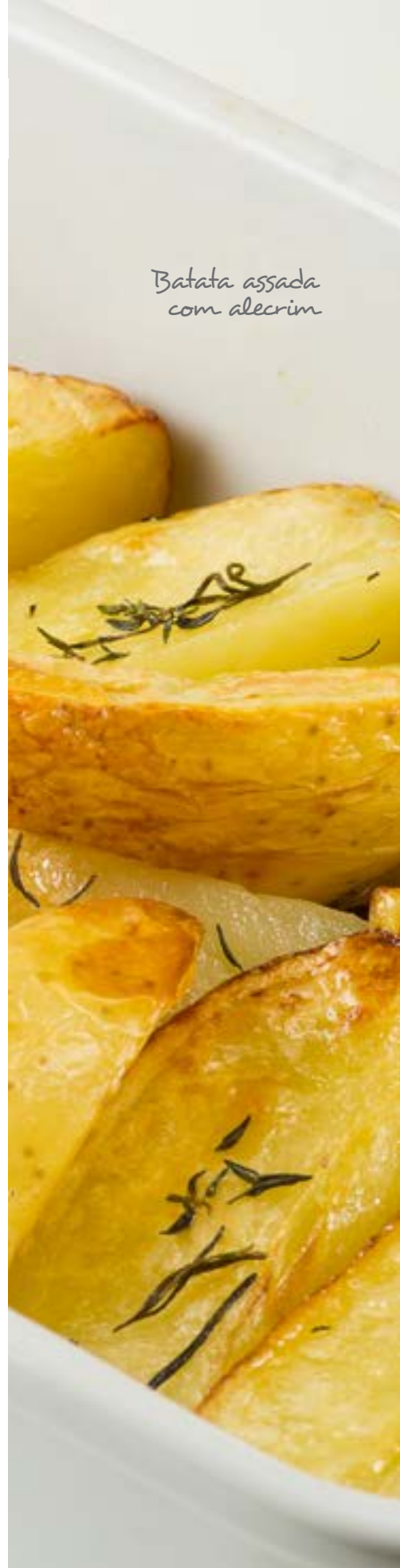
Batata assada com alecrim

A mandioca consumida na forma de farinha é acompanhamento frequente de peixes, legumes, açaí e vários outros alimentos. A farinha de mandioca também é usada como ingrediente de receitas de pirão, cuscuz, tutu, feijão-tropeiro e farofas. Nas regiões Norte e Nordeste, substitui com frequência o arroz na mistura com o feijão.