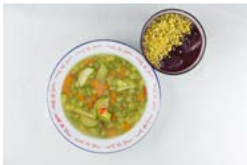
Sopa de legumes, farinha de mandioca e açaí