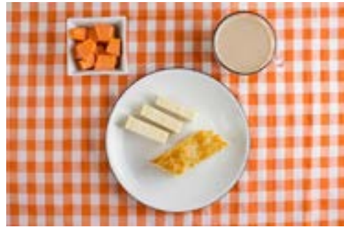
Café com leite, bolo de mandioca, queijo e mamão