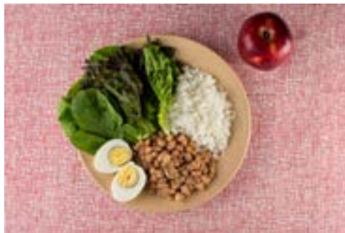
Salada de folhas, arroz, feijão, ovo e maçã