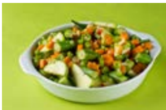
Mix de legumes refogados