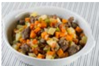
Cozido de carne com batata e legumes