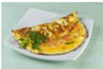
Omelete com legumes