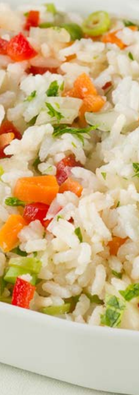
Arroz com legumes

Da mesma forma que nas preparações de feijão, o uso de óleo e sal no preparo culinário