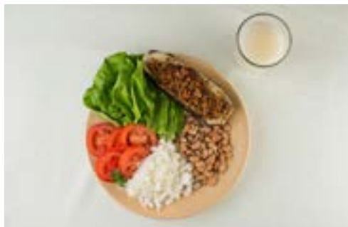
Alface e tomate, arroz, feijão, berinjela e suco cupuaçu

Em um dos exemplos, nota-se o uso de lentilhas no lugar do feijão. Em outro, o feijão aparece ao lado da farinha de mandioca (e não do arroz). Em outros dois exemplos, preparações à base de milho (angu e polenta) acompanham o feijão com arroz.