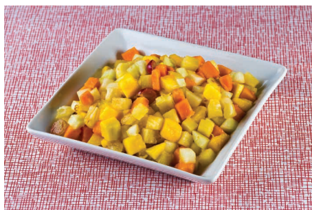
Salada de frutas