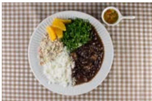
Feijada, arroz, vinagrete de cebola e tomate, farofa, couve refogada e laranja