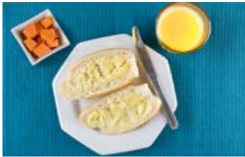
Suco de laranja natural, pão francês com manteiga e mamão