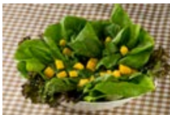
Salada de folhas com manga