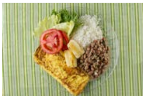
Alface, tomate, arroz, feijão, omelete, mandioca de forno