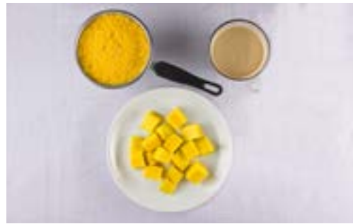
Café com leite, cuscuZ e manga

Com relação aos demais alimentos do café da manhã, a variedade é grande, incluindo o consumo de preparações à base de cereais ou de tubérculos e mesmo, em um dos exemplos, o consumo de ovos. A variedade reflete preferências regionais exemplificadas com o consumo da tapioca, do cuscuZ e do bolo de milho.