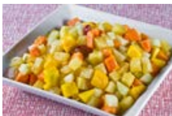
Salada de frutas

O Brasil possui enorme variedade de frutas: abacate, abacaxi, abiu, açaí, acerola, ameixa, amora, araçá, araticum, atemoia, banana, bacuri, cacau, cagaita, cajá, caqui, carambola, ciriguela, cupuaçu, figo, fruta-pão, goiaba, graviola, figo, jaboticaba, jaca, jambo, jenipapo, laranja, limão, maçã, mamão, manga, maracujá, murici, pequi, pitanga, pitomba, romã, tamarindo, tangerina, uva.