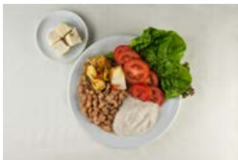
Alface, tomate, feijão, farinha de mandioca, peixe e cocada