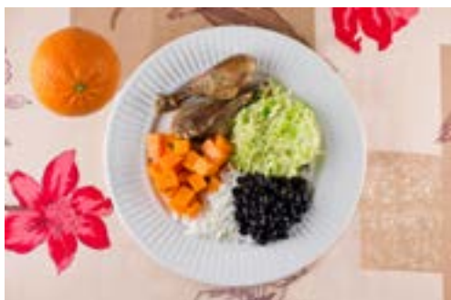
Arroz, feijão, coxa de frango, repolho, moranga e laranja