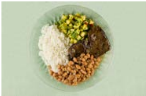
Arroz, feijão, fígado bovino e abobrinha refogada