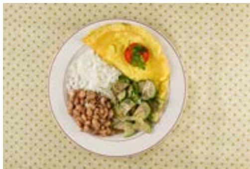
Arroz, feijão, omelete e jiló refogado