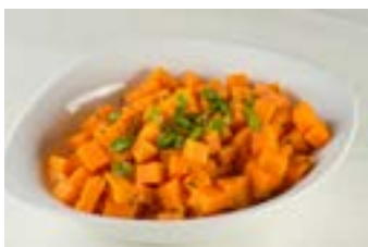
Abóbora refogada com cebola, cebolinha e/ou salsinha

A diversidade de legumes e verduras é imensa no Brasil: abóbora ou jerimum, abobrinha, acelga, agrião, alface, almeirão, berinjela, beterraba, brócolis, catalonha, cebola, cenoura, chicória, chuchu, couve, espinafre, gueroba, jiló, jurubeba, maxixe, mostarda, ora-pro-nóbis, pepino, pimentão, quiabo, repolho e tomate. Variedades dentro de um mesmo tipo são frequentes e variam conforme região, como no caso da abóbora, que pode ser a paulista, a baianinha, a de pescoço, a menina, a japonesa ou a moranga, ou da alface, que pode ser lisa, crespa, americana, roxa, romana.