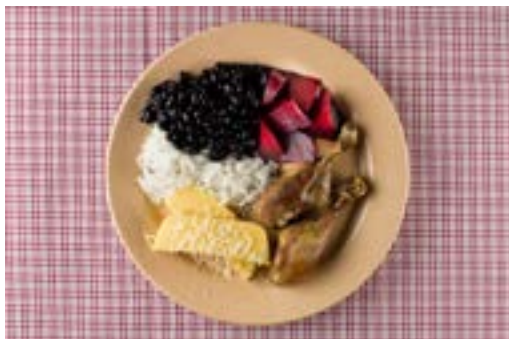
Arroz, feijão, coxa de frango assada, beterraba e polenta com queijo