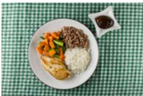
Arroz, feijão, peito de frango, abóbora com quiabo e compota de jenipapo