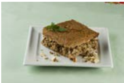
Quibe de carne assado com nozes

Este grupo de alimentos inclui vários tipos de castanhas (de caju, de baru, do-brasil ou do-pará) e nozes, e também, amêndoas e amendoim.