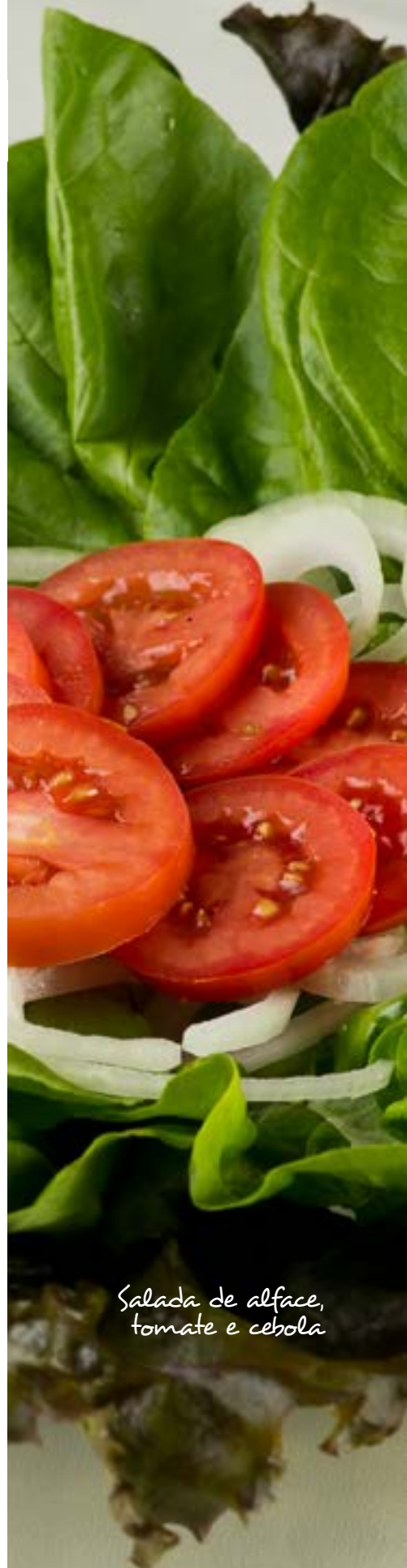
Salada de alface, tomate e cebola

Boa parte dos legumes e verduras é comercializada em quase todos os meses em todas as regiões do País. No entanto, tipos e variedades produzidos